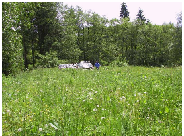
Late zomerbloemen in onze tuin