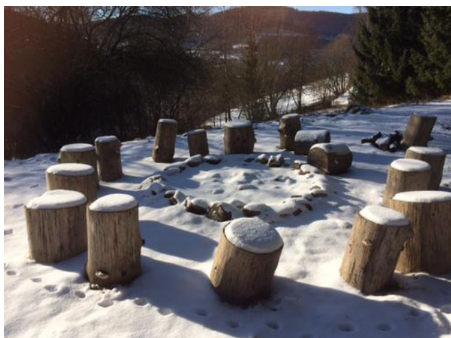
Sneeuw op onze vuurplek

Ook geeft dit perspectieven voor het verder ontwikkelen van het eigen gezicht van Savita. Stap voor stap gaan we samen met de nieuwkomers een vorm laten ontstaan, waardoor de mogelijkheid geboden kan worden om Savita, als tankstation te laten fungeren voor mensen die het contact met zich Zelf willen herstellen, na een ingrijpende gebeurtenis, mensen die iets in hun leven (dus in zichzelf) tot bloei willen laten komen, mensen die met mensen in contact willen komen enz. Het is steeds duidelijker voelbaar: Savita vindt langzaam aan haar eigen vorm.