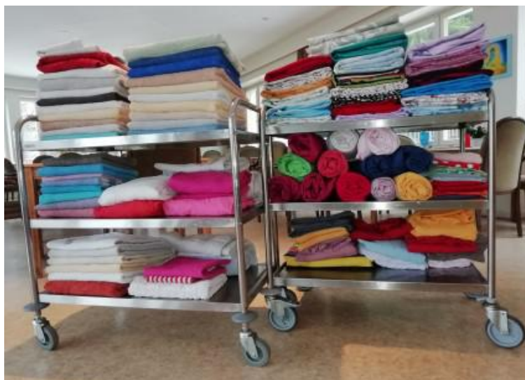
Dat WAS de WAS