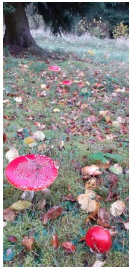
Herfstgroetjes van Savita