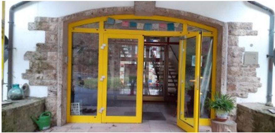
De deur is alvast voor je opengezet

Onze boekhouder is aan het uitzoeken of we via Winterberg weer financiële steun kunnen ontvangen, net als in het voorjaar: 2x negenduizend! We hebben het afmaken van het dak, (de andere helft van het dak van het hoofdgebouw), uitgesteld tot in het voorjaar. Misschien hebben we dan meer zicht dan nu, hoe de kaarten liggen. En we hebben nog ietsje pietsje waarmee we het nog wel even kunnen uitzingen. Dit alles even ter geruststelling. Volgens ons is het de bedoeling dat juist een plek als Savita mag blijven voortbestaan, als pijler voor de wederopbouw van de chaos die zich momenteel afspeelt in de wereld.