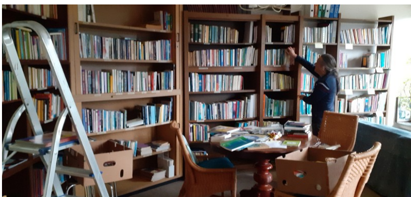
Tijd voor grote beurt van o.a. bibliotheek en de kelders

Wat betreft de vereniging, ook daar ligt natuurlijk dezelfde vraag: gaat het Vriendenweek-end door, het derde weekend in maart.....?????Geen idee. En wanneer dan wel???? Als er nieuws is, dan kan je dat, zoals altijd, vinden op de eerste bladzijde van de website. Zodra wij weten of dit weekend doorgaat, zetten we het erop. Je kunt altijd, ook in Coronatijd of beter gezegd, juist in Coronatijd lid worden van de vereniging/vriendengroep van Savita. Hoe meer zielen.....hoe sterker het Licht, waardoor de duisternis kan oplossen. De leden krijgen volgende week een mail, waarin wordt gevraagd om het lidmaatschapsgeld, ( 25 euro), te betalen. (Dit kan in de maanden januari, februari en maart).