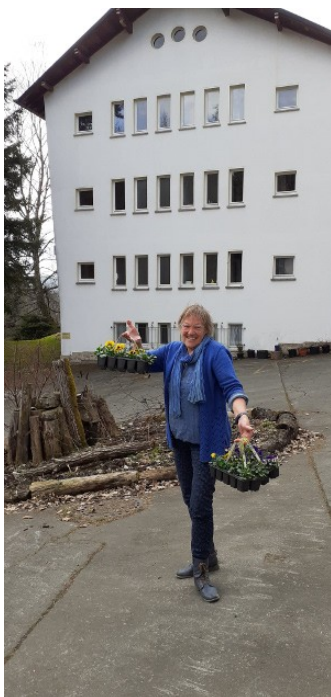
Jaay, de lente is ook in Savita aangekomen!!!

* Er is iemand op Savita geweest, die een fantastische biologische zaderij in de N.O. Polder heeft opgezet. Als je zaadvaste zaden wil gaan gebruiken, deze zaden zijn dus reproduceerbaar, klik dan op: www.zaderij.nl Als je het leuk vindt om daar als vrijwillig(st)er mee te werken, is dit ook een hele fijne plek, nu de Savita tuin voor jou voorlopig nog onbereikbaar is!