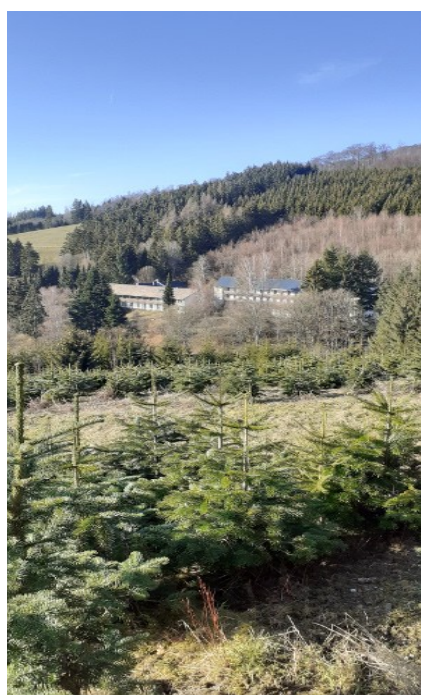
Savita, nu nog ver weg, hopelijk snel weer dichtbij!