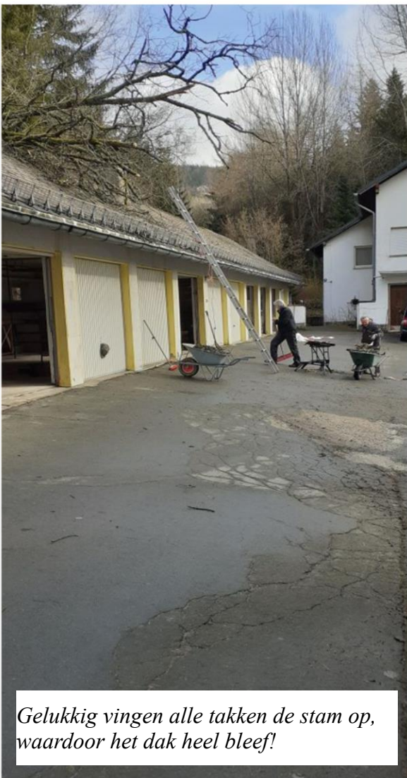
Gelukkig vingen alle takken de stam op, waardoor het dak heel bleef!

we zijn met z'n allen afgelopen week-end weer heel uit de verwarring te voorschijn gekomen!!