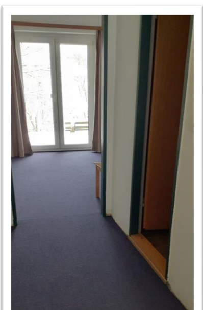
In sommige kamertjes leggen we nieuwe vloerbedekking!