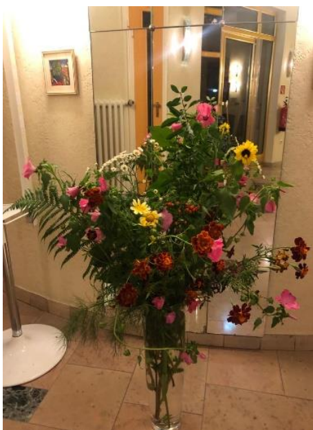
Geschonken door Irna Grotenbreg!