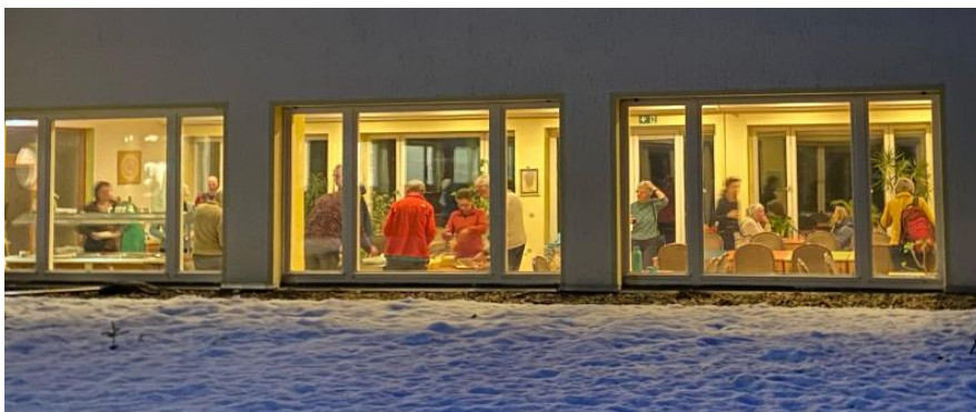
Savita by Night...

Onderling zijn we nu goed op elkaar ingesteld en we kunnen goed samenwerken. Dat geeft een heerlijk rustig gevoel. Mede dankzij de bereidwillige handen van veel medewerkers. Het is al vaker hier geschreven: zonder de medewerkers is het niet mogelijk deze unieke woon/werkvorm te creëren, waarbij ieder elkaar dient. Sommige medewerkers komen voor 1 keer, sommige voor meerdere keren, sommigen in een vast verband en weer anderen wisselen een langdurig verblijf af met het heen en weer gaan naar Nederland. Dit geeft iedere keer weer een verandering van samenstelling dus een ander kleurenpalet! En het helpt ook onze geest soepel en jong te houden!!