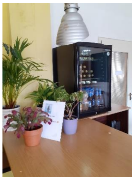
De 'coole' nieuwe koelkast in het theehuis...