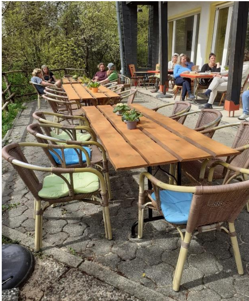
Een van de Jubileumcadeaus - nieuwe terrasstoelen!

Voor de AGENDA van Savita: aanklikken bij deze link .