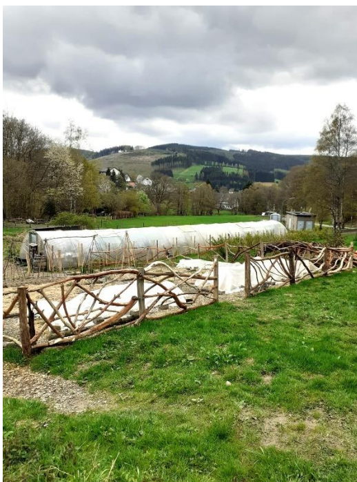
Een nieuw hek voor de tuin

Verder zijn er toch wat betreft 2024 nog wat open plekken voor groepen, vooral in de maanden november en december. N.B. Het verenigingsweekend vindt plaats van 13-15 september.